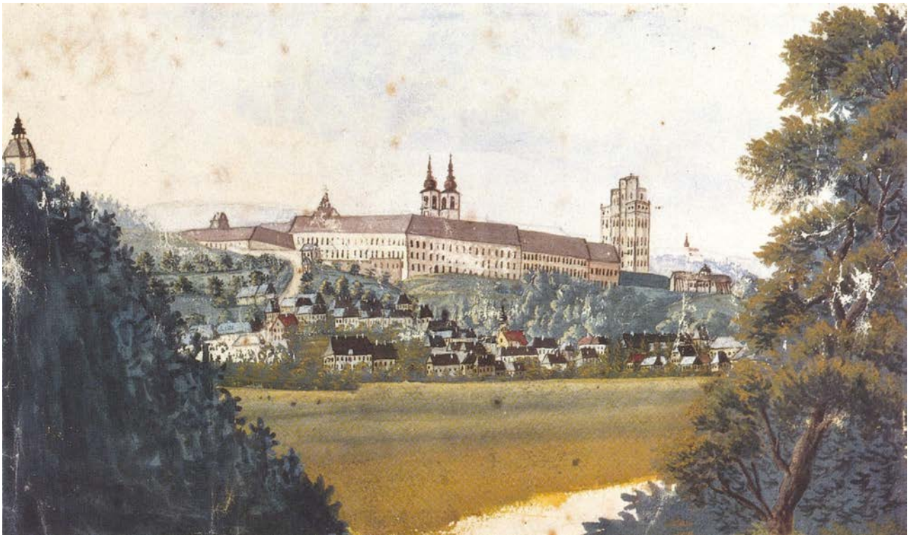
Abb. 1: Adalbert Stifter: Das Stift Kremsmünster . Aquarell 16,2×9,7 cm, ca. 1823-1825, unvollendet; rechts im Bild der große astronomische Turm mit Sternwarte. Zur Beschreibung siehe [47] (S. 95, Nr. 5). (aus [3], S. 22-23)

umfasste vier Grammatikal-, zwei Humanitäts- und zwei Philosophieklassen, in denen Religion, Latein, Mathematik, Naturgeschichte und -lehre, Geographie, Geschichte, Griechisch, Rhetorik und Poetik bis zur Universitätsreife vermittelt wurden. 11 Somit durchliefen beide ähnliche grundlegende Ausbildungsgänge; für Kepler geschah dies 1584-1591 an der niederen Klosterschule Adelberg, der höheren Klosterschule Maulbronn und im propädeutischen Studium im Evangelischen Stift in Tübingen.