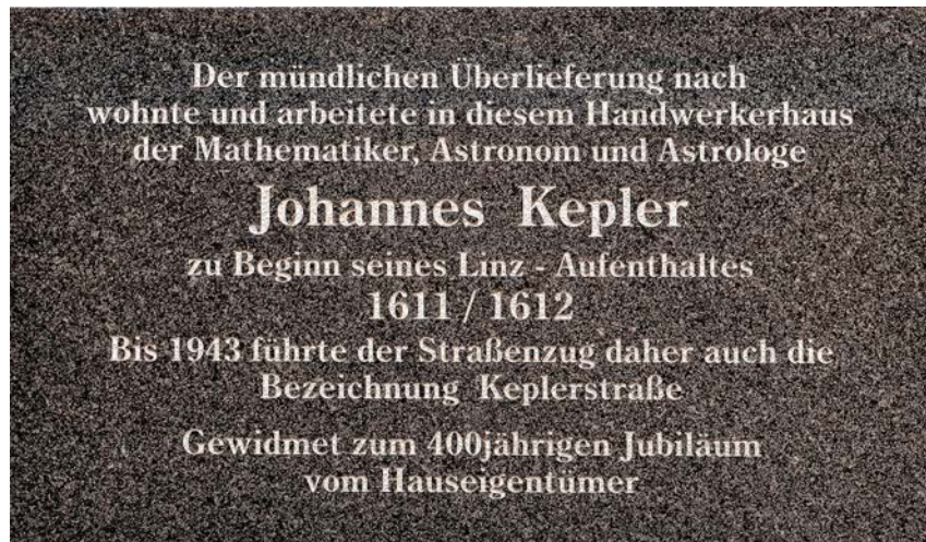
Abb. 5: Neue Gedenktafel am Gebäude Lederergasse 10, angebracht vermutlich 2011. Die dort erwähnte mündliche Überlieferung hatte sich als falsch herausgestellt.

Unterbringung im Landhaus während des oberösterreichischen Bauernkriegs – mit seiner Familie gelebt hatte. Die Rathausgasse 5 – der heutige Sitz des Kepler Salons – war sein letzter Wohnsitz, zuvor war es Hofgasse 7 und davor Kapuzinerstraße 18. 72