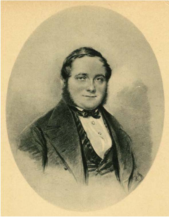
Abb. 2: Adalbert Stifter. Künstlerpostkarte des Verlags Wiechmann, München, nach einem Aquarell 9,3×10,6 cm, 1845/1846, des Wiener Miniatur- und Portraitmalers Moritz Michael Daffinger (1790-1849). Zur Beschreibung siehe [50].